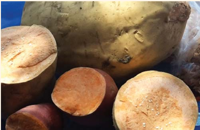
Picha 4: Aina ya viazi lishe vinavyolimwa kijiji cha Ilindi