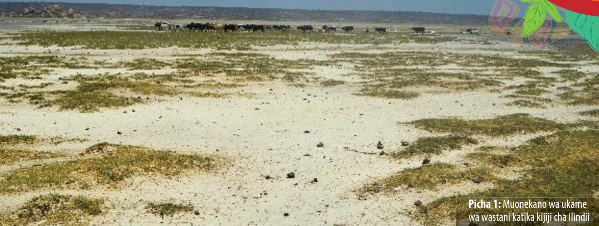
Picha 1: Muonekano wa ukame wa wastani katika kijiji cha Ilindi