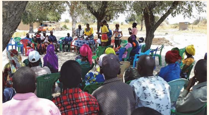
Picha 5: Jamii ya Ilindi ikizindua mpango wa miaka 4 wa viazi lishe

Kuimarisha Lishe ya Makundi ya Vyakula Mchanganyiko (Building Nutritious Food Baskets – BNFB). Mradi huu wa