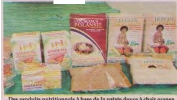
Des produits nutritionnels à base de la patate douce à chair orange

Wtmnc hay Ya.:o. rq>rbentante deiijCJ mu ltlvatlle ckpu1.l plus d'unc dCcamec en collabonatJoct avec l'INERA, l'IRSAT et l'UO Cette ONG est la ptmniae Ia motion de: Ia POCO qu'ellc: • rnuodurte en 200 l daM — pl'tJel de: J.wdin.Jtc sc:olam: ct c:omnw