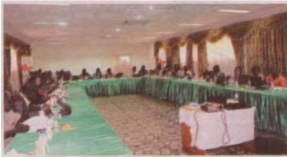
t...diffhomta adrun cle la promotioD cle la POCO aKtiftllt

U c.uence m aticonutriments est un probl me de Anté publique qui provoque de nombreuHS c renc. dont celle en vitamint! A. u patate douce à chair orange (POCO) rep nte une alternative efficace à ces maux. Un plldoyd en bveur de 11 promotion de ce tubercule a été organise le 9 septembre 2014 pu Helen keller international (HKI) ■ Ou< gadougou.